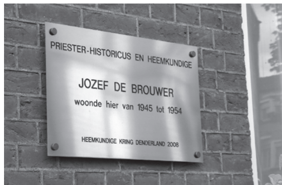
Gedenkplaat ter ere van Jozef De Brouwer in Hofstade.

wandeling langs het Oude Molenwandelpad. Bij deze wandeling werd een symbolische gedenkplaat onthuld ter ere van Jozef De Brouwer. Bij de oorspronkelijke opening van het Oude Molenpad had men reeds aangedrongen bij het gemeentebestuur om het pad naar pastoor De Brouwer te noemen. Toen beriep men zich op het feit dat de persoon in kwestie nog in leven was en men bijgevolg zijn naam niet mocht gebruiken. (J.V. 1995)