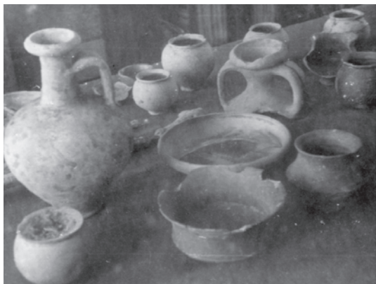
Een deel van de opgravingen uit Hofstade.