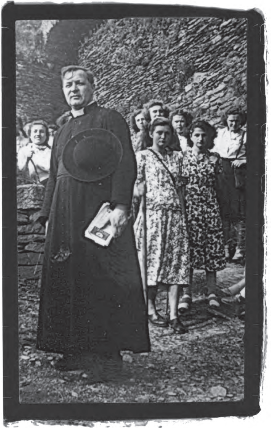
Het parochieleven De eerste heemkundige activiteiten Het Comité voor Recht en Naasteliefde Afscheid van Hofstade