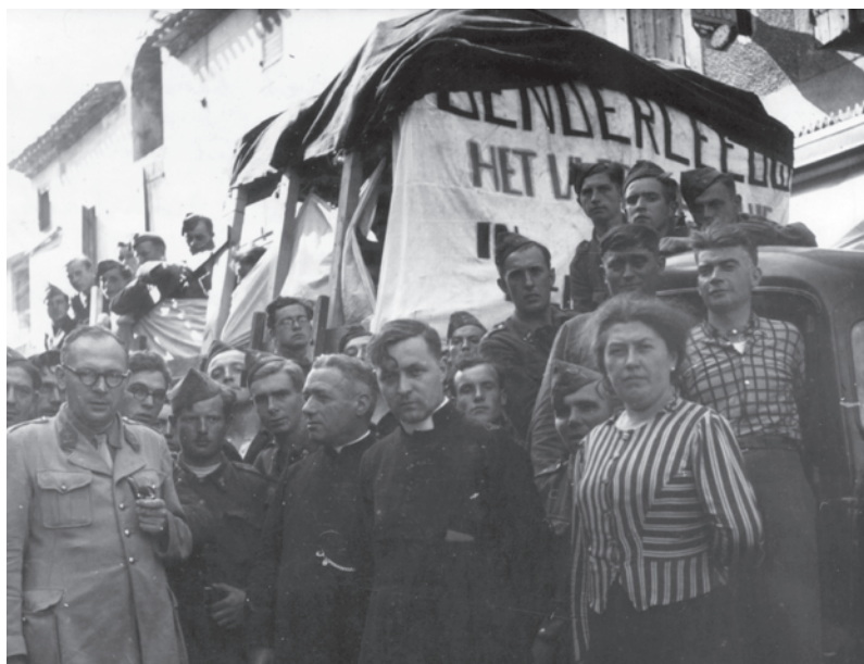
Het Vlaams Kruis van Denderleeuw te La Redorte.

De mobilisatie werd op 10 mei 1940 gevolgd door de Tweede Wereldoorlog. Op vrijdag 17 mei 1940 werd de bevolking van Denderleeuw door de aftrekkende Engelsen verplicht de gemeente te ontruimen. Ik trok met Julia (De Brouwers huishoudster n.v.d.r.) en haar ouders naar huis, ... waar vader en moeder naar den Ekent trokken. Mijn zuster ging met haar gezin op vlucht naar Frankrijk. Op zondag 19 mei 1940 werd het dorp door de Duitsers bezet, nadat het door de artillerie was beschoten en de kerk -vooral de toren- zwaar was beschadigd. Op maandag keerde ik terug en vond mijn huis ten dele leeggeplunderd, zoals trouwens tal van andere woningen. (De Brouwer s.d. a.,8)