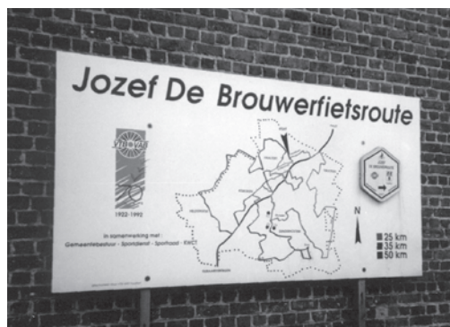
Het oriëntatiebord van de Jozef De Brouwer-fietsroute in de Warande te Haaltert.

In Haaltert, het geboortedorp van Jozef De Brouwer, werd op 20 september 1992 officieel de Jozef De Brouwerfietsroute ingereden. Meer dan 900 fietsers waren ingeschreven voor de tocht. Het oriëntatiebord in de