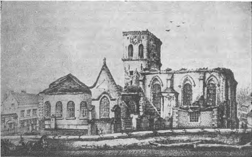
Puin der afgebrande kerk (1869).

De kollegiale kerk van Haaltert behoorde tot de Vroeg-Gothische stijl. Zij onderging talrijke verbouwingen, vooral in het midden der 15 e eeuw en in 1841, wanneer de kerk merkelijk werd vergroot. Op 9 Februari 1869, door de bliksem getroffen, brandde ze uit en werd gesloopt.