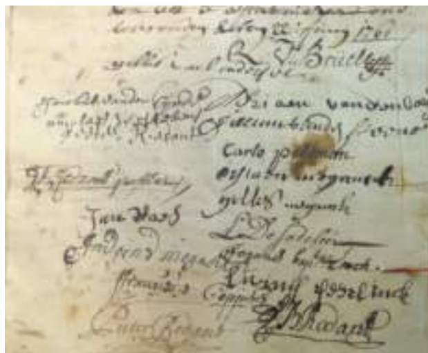
Algemeen Rijksarchief te Brussel – Raad van Financien I 103 n° 1868