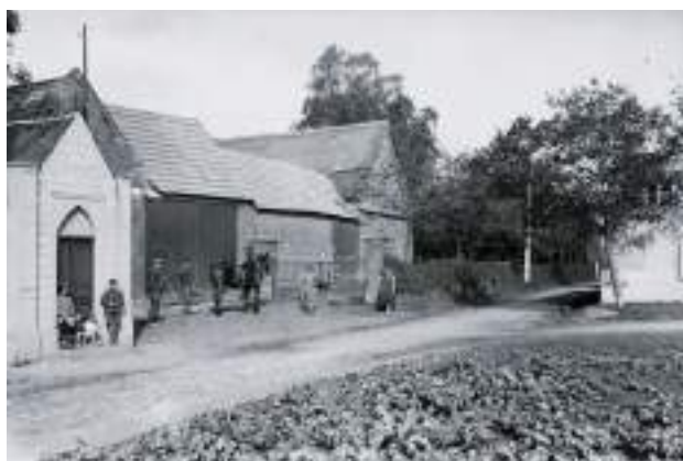
Tekst onder foto: De hoeve met kapel t.e.v. de H.Gaugericus.

De naamswijziging is logischerwijze verbonden met de bewoners van de hofstede. De hoeve die er reeds