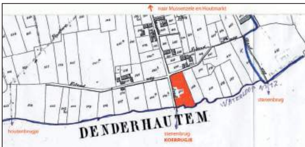
Detail uit de Atlas cadastral de Belgique. Plan parcellaire de la commune de Haaltert.