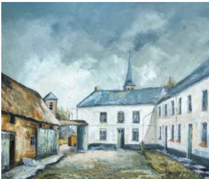
Oorspronkelijke hoeve in 1761, bemerk links de duiventil

De schepenbank verhuisde naar de herberg 'De Vierschaar' rechtover de kerk, dat in de jaren zestig nog dienst deed als gemeentehuis (4) .