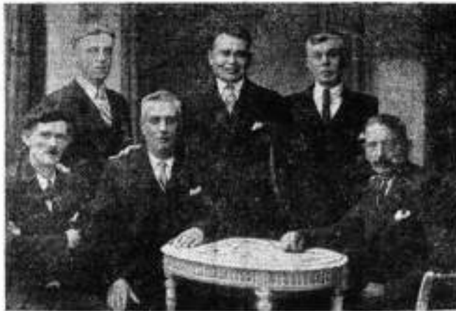
Propagandisten Belg. Soc. Partij in 1911.

Tijdens de wintermaanden heeft de propaganda van de vakbond in het bijzonder eens te meer aan de arbeidende klasse het bewijs geleverd dat wie zich verenigt, in het ABVV op zijn plaats is. De verantwoordelijken van de verschillende socialistische arbeidersbewegingen zijn overtuigd dat Kerkken nog schonere dagen te beleven heeft, en zonder twijfel mag worden voorspoken dat het bewijs zal geleverd worden door de bereidwillige kameraden van ter plaatse.