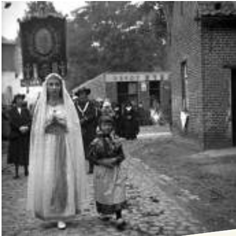
Depot ETERNIT aan de Achterstraat