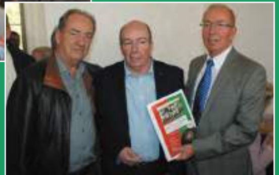
De '3 Van der Vekens' basisspelers van de Racing