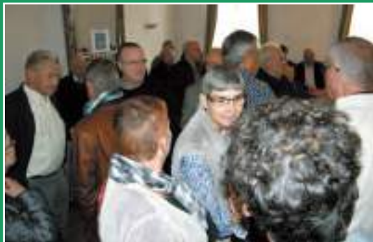
De auteurs: Alex Van der Veken en Marcel Baetens