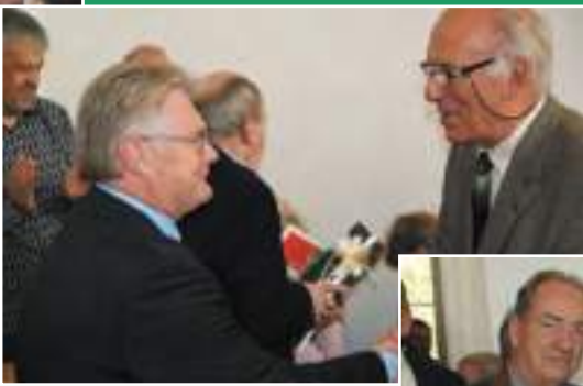
Felicities voor de auteurs