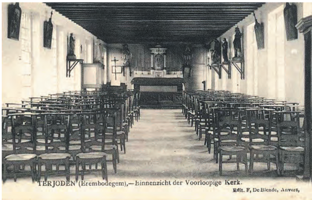
TERJODEN (Erembodegem).— Binnenzicht der Voorloopige Kerk.

Het geluk dat wij heden genoten legt ons plichten op die wij getrouw zullen naleven, plichten van dankbaarheid jegens God die ons smeeken heeft verhoord, onze wenschen heeft verwezenlijkt, plichten van dankbaarheid jegens den gevierden Herder die zijne krachten, zijne begaafdheden, zijn edel hart komt ter offer brengen op het altaar der Kristene naastenliefde,