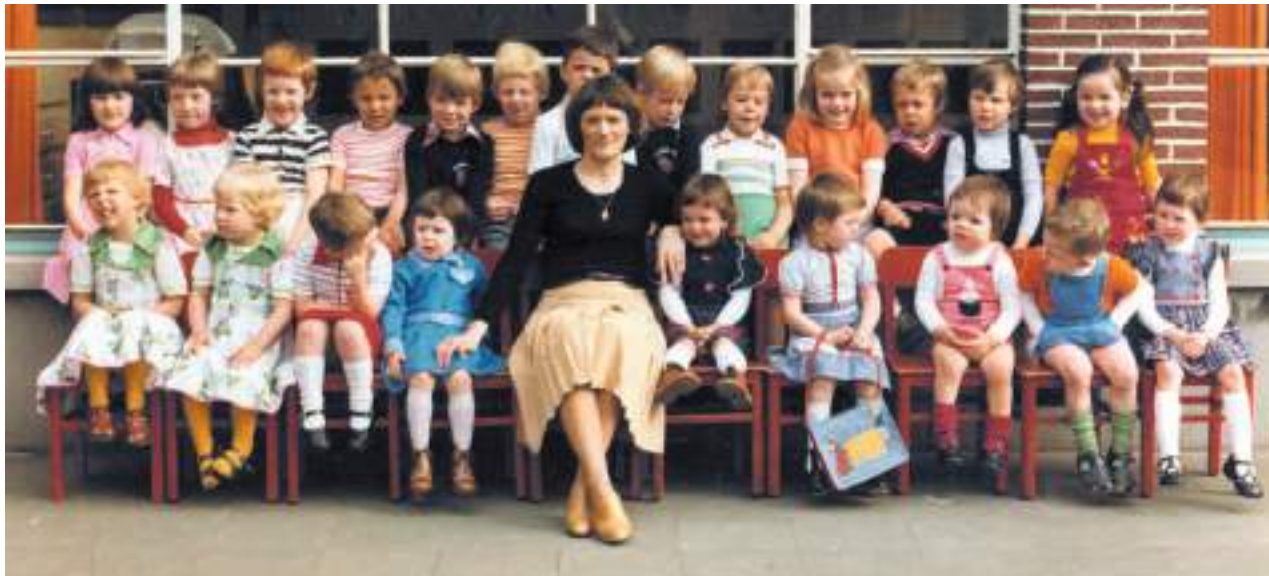
Klasfoto wijksschool Dries - schooljaar 1978 - 1979

De opbrengst van het festijn werd integraal besteed aan de renovatie van het klasinterieur en de aankoop van pedagogisch materiaal voor de kleuters, waarin schoonvader en echtgenoot een speelzolder hadden gebouwd.