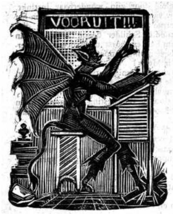
Spotprent van geuzenonderwijzer Alfons Blom

Hij werd geboren te Smetlede op 7 december 1844. Op 5 juli 1873 huwde hij met Florentine Van Melkebeke uit Denderhoutem.