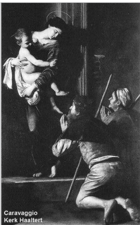
Caravaggio Kerk Haaltert

Misschien toch een tip voor kerkbezoekers: loop vooraan naar de altaren en bewonder even deze 'kerkschatten'.