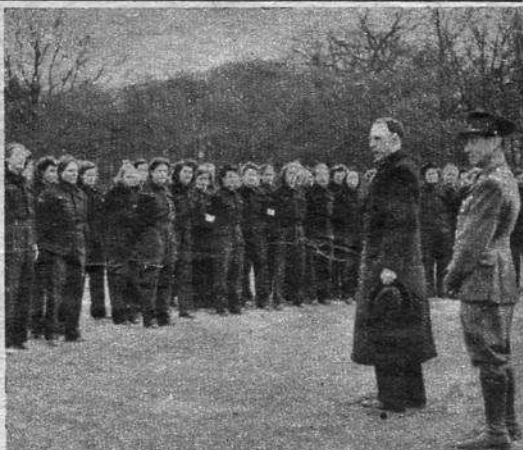
De Belgische minister bij de Luxemburgsche regering op bezoek bij de Belgische vrouwen die zich nu reeds voorbereiden op haar taak na de bevrijding, een taak van hulp en bijstand aan haar landgenooten. Les femmes belges en Angleterre s'entraînent en vue des tâches de secours et d'assistance qui les attendent à la libération de la patrie. Le Ministre de Belgique auprès du Luxembourg s'adresse à ces volontaires lors de sa visite à un de leurs camps d'entraînement.