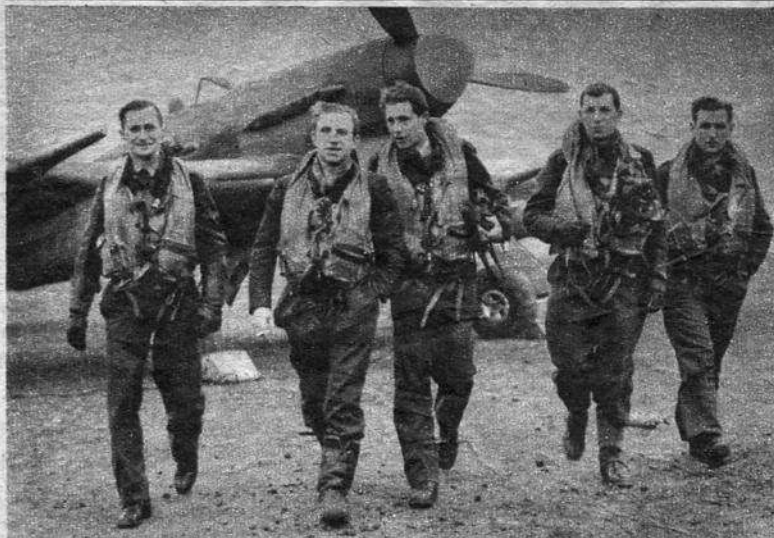
Belgische jachtpiloten keeren na een vlucht terug op een vliegveld ergens in Engeland. De geallieerde luchtmacht is trotsch op Uwe landgenooten en zij zult op hen niet minder trotsch zijn! Cinq pilotes de la glorieuse phalange des chasseurs belges d'Angleterre rentrent au terrain après avoir accompli une mission. Les pilotes belges constituent un corps d'élite de l'aviation des Nations Unies.