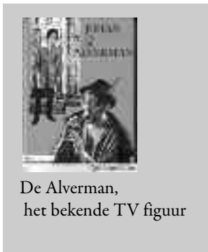
De Alverman, het bekende TV figuur

In Aalst zegde men vroeger “ hij is door den Alf bereën”. Het is een gezegde dat voorkwam in heel Brabant. Men zei dit wanneer iemand gek was of zich vreemd gedroeg. Niet alleen de kludde had het alleenrecht op de rug van mensen te springen, ook een Alf of Alverman kon dit doen. De Alf sprong op je rug en je kon er je niet van ontdoen. Mensen die ‘van de alf’ waren geleid, moesten urenlang ronddolen en zweetten verschrikkelijk. Slechts wanneer de kerkklokken luidden, stopte de Alf.