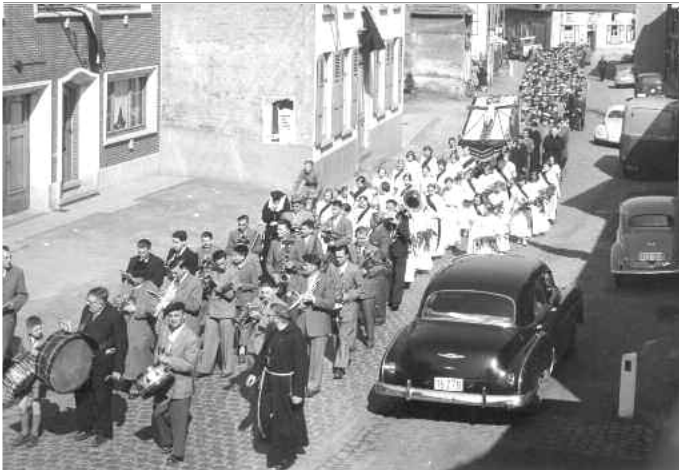
Er was nog plaats op de kasseien voor processies...

De Kruistocht was het hoogtepunt en de afsluiting van de twee jaarlijkse missieweek. De E.W. Paters Kapucijnen uit Aalst “bruine paters”, zorgden een ganse week voor donderpreken vooral wat het zesde en het negende gebod betrof. .