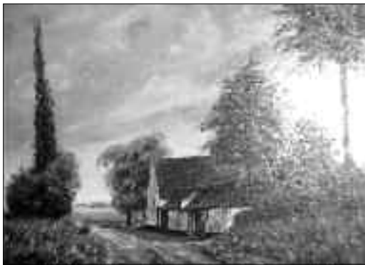
“De Byloke”, een doek van Albert Eeman