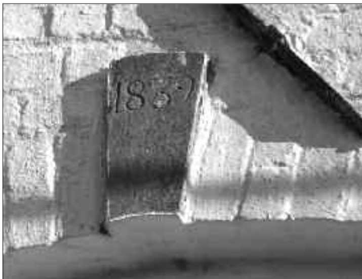
Siersteen boven de poort van de Bylokehoeve