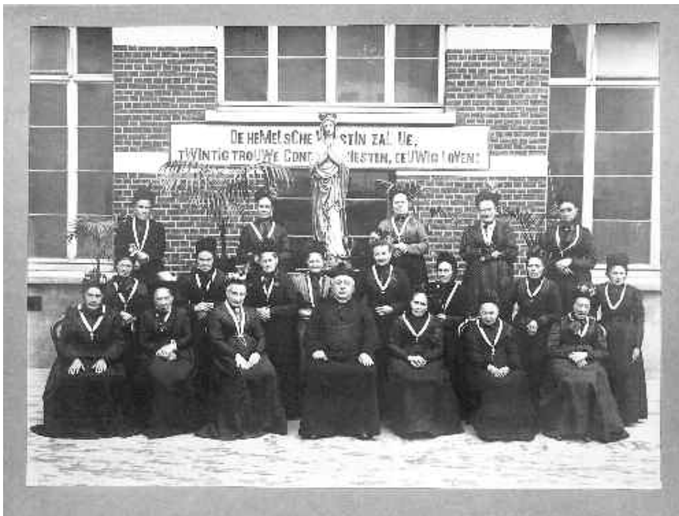
Prachtige opname van congreganisten uit Denderhoutem. Het cronogram (jaarschrift) geeft 1859.