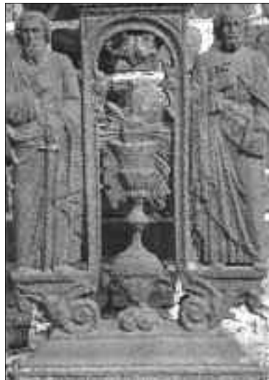
Details van het kruis