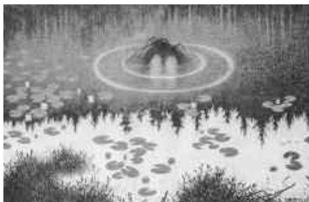
Nekker volgens een schilderij van Theodor Kittelsen

In andere streken staat hij bekend als "Nekker". Denk aan het recreatiegebied bij Mechelen "de Nekkerspoel". Hier zou een Nekker hebben gewoond en die wandelaars zou "genekt", dus gesard hebben. Ook volgens de legende zou Sint-Rombout de Nekker verjaagd hebben.