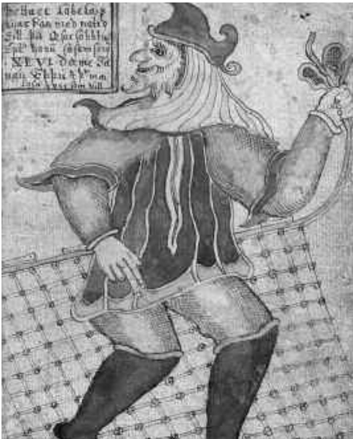
Loki uit een 17 de eeuws IJslands geschrift

Dit artikel gooit een blik op de bonte wereld van griezels die onze Vlaamse folklore rijk is.