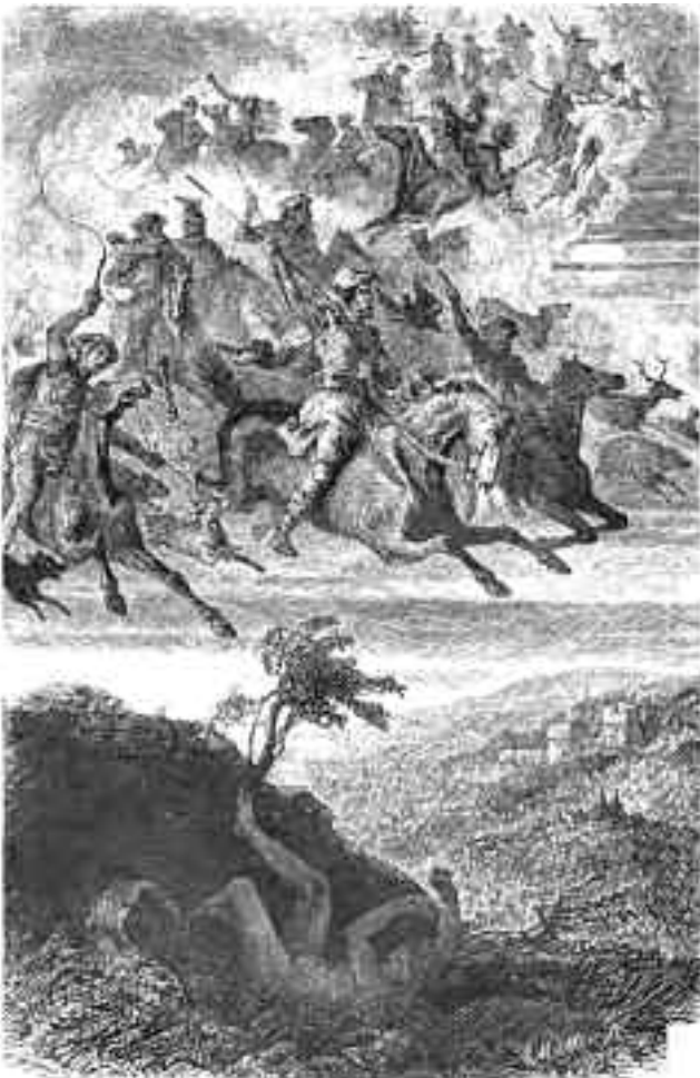
De Wilde jacht van Odin

Misschien werd ook bij ons het varken gehouden als soort goddelijk symbool van vruchtbaarheid. Al is het meezaaien van zijn beenderen met de volgende oogst hier in de loop der tijden verloren gegaan.