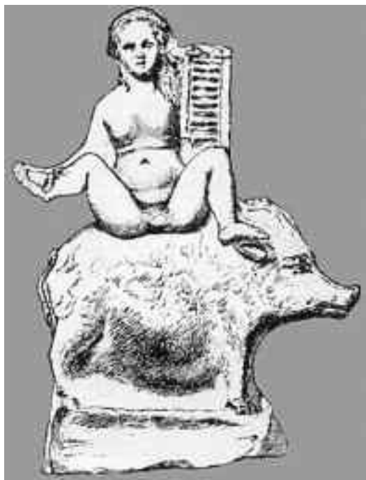
Bauba de godin van de vruchtbaarheid rijdend op een varken (Romeins beeldje)

Men vindt verhalen van de korenpater terug te Hulshout, Leuven, Boechout, Hoegaarden, Meldert, Kaggevinne, Moen, Balen e.a. In Eindhout werd hij de tenensnijder genoemd, op andere plaatsten korenmenneke. Er zijn ook verhalen bekend van jongens die zich verkleedden als de korenpater en de meisjes in het graan trokken.