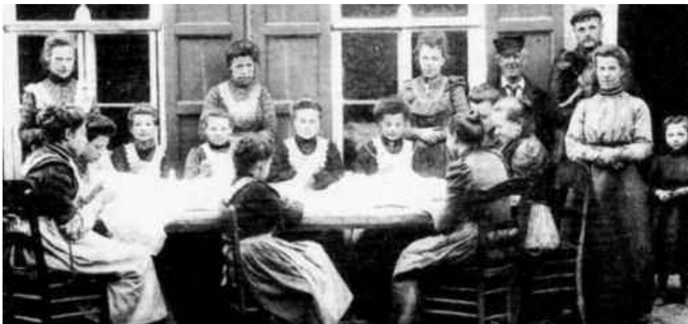
1905: aan het kantkussen op Coster's Hof in de Boekent