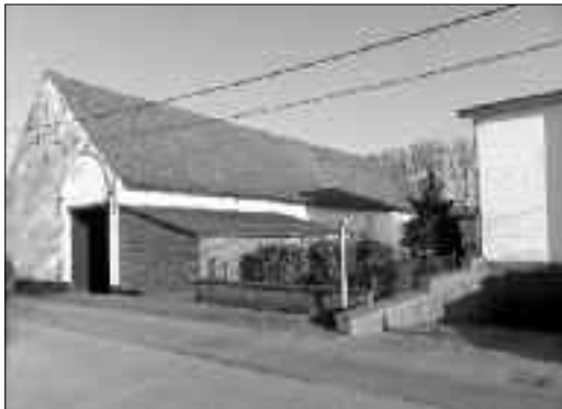
De gerestaureerde schuur