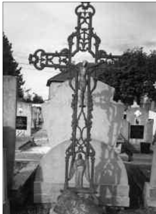
Haaltert, verdwenen kruis

Het enige exemplaar op het kerkhof van Kerksken was nog in bevredigende toestand maar ook hier was de identiteit van de overledene niet te achterhalen aangezien er evenmin een plaatje aanwezig was.