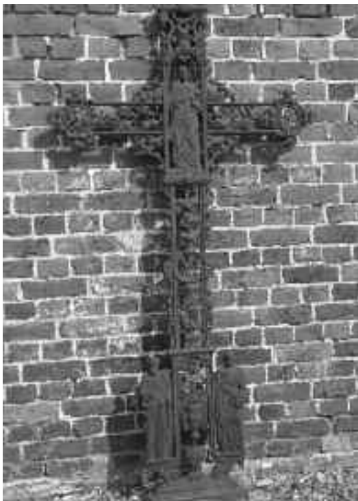
Heldergem - kruis graf E.H. De Mayer

Het is uiteraard niet te achterhalen hoeveel gietijzeren kruisen er op de begraafplaatsen oorspronkelijk hebben gestaan. Het zal wel geen enorm aantal geweest zijn vermits ze zeker niet