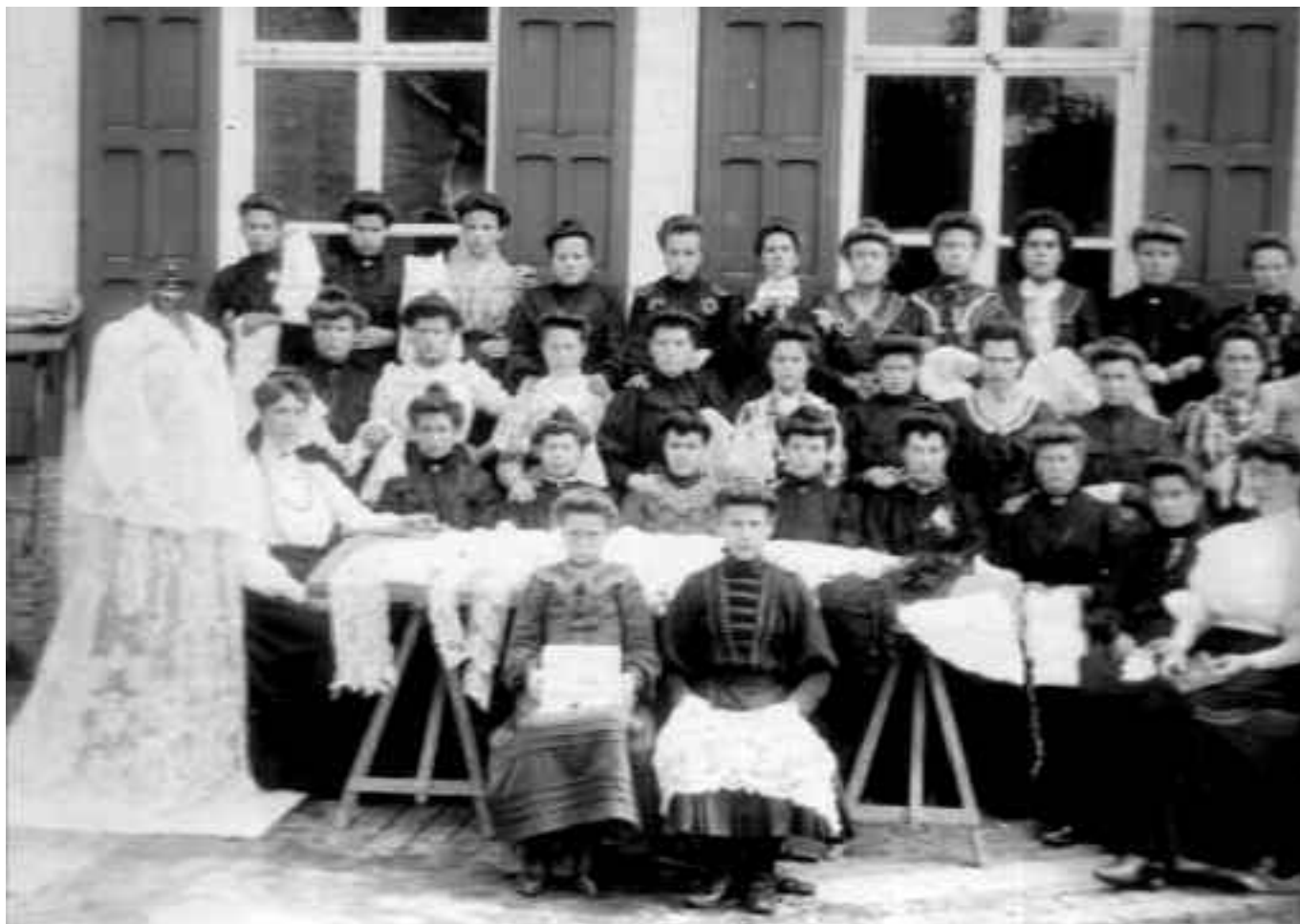
Volgens mededelingen: Kantschool Haaltert. Weet iemand meer over deze foto?