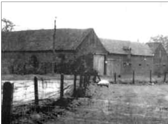
Borrekent: hoeve Huylebroek - Cobbaert. (zie vorig nummer)