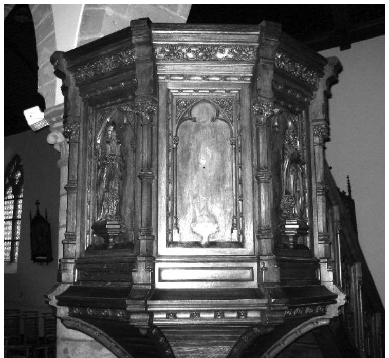
Preekstoel – kuip na diefstal