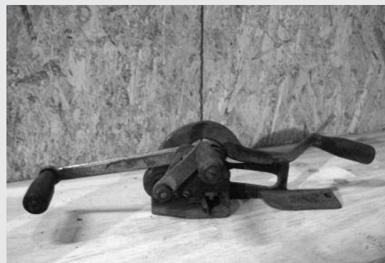
Toestel van firma Le Tendeur . Functie ?