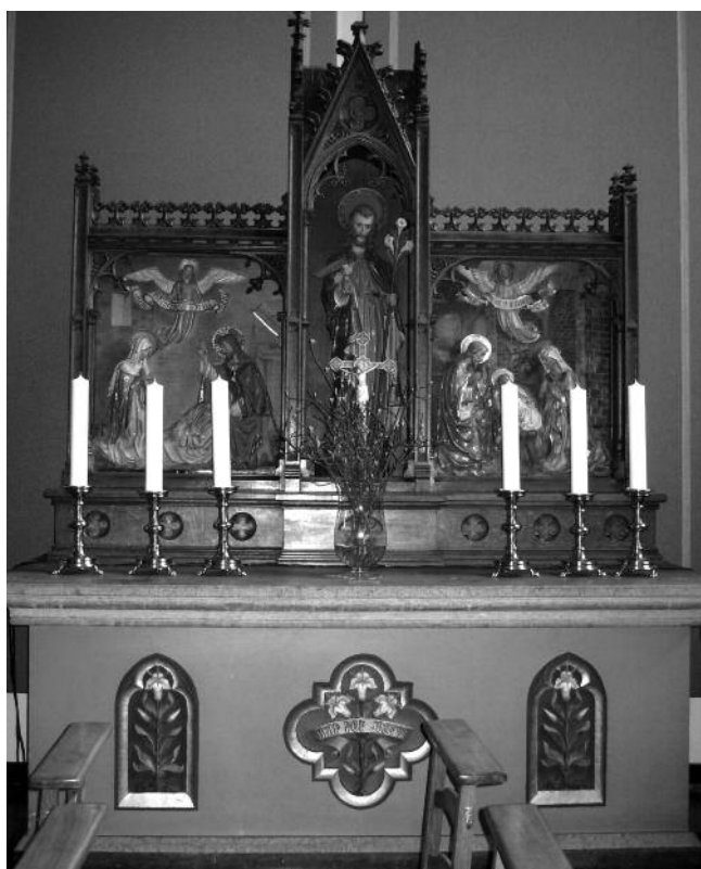
Sint Jozef altaar