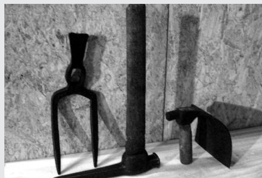
Functie werktuigen ?