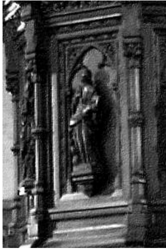
Detail gestolen Johannesbeeld

De beveiliging van kerken tegen kunstdiefstallen is een oud zeer: kerken zijn nu eenmaal openbare plaatsen. Waar er vroeger nog ruime sociale controle was over eventuele bezoekers die buiten de erediensten over de drempel kwamen is dit nu jammer genoeg niet meer het geval. Nu was de St. Amanduskerk aan de beurt. De diefstal van één der beeldjes die de kuip van de preekstoel sierden werd vastgesteld op 15 december 2009.