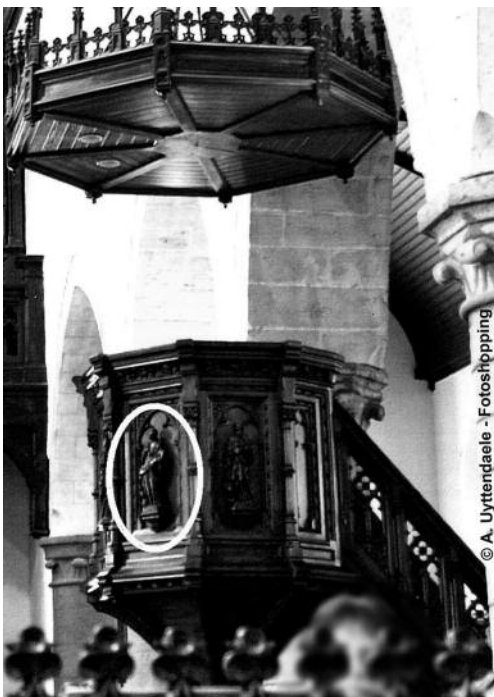
Preekstoel – met Johannesbeeld voor diefstal

De hierboven gepubliceerde foto is een detail van een foto van de nog intacte preekstoel (links) ons bezorgd door fotograaf A. Uyttendaele.