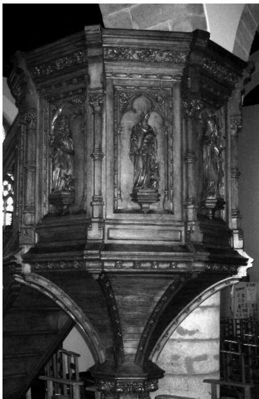
Preekstoel – kuip