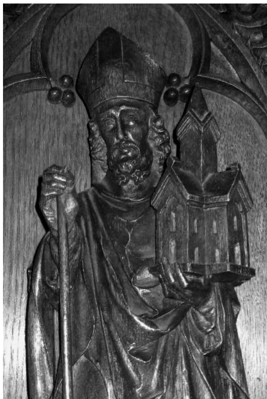
Sint Amandus – detail