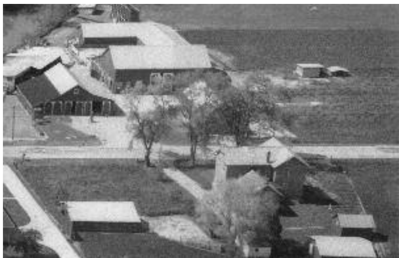
Hoeve van Maurice Lievens, zoon van Alfons, die met een weg verbonden was met het ouderlijk huis (vooraan) Hij bewerkte 160 acres (circa 65 ha)