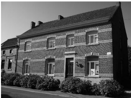
nr 84 : Gezusters Antheunis - kantwerk