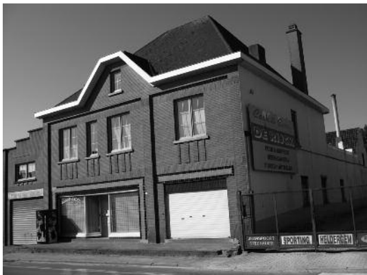
nr 58 : Gustaaf De Rijck - Leonie De Troyer Handelaar in fietsen