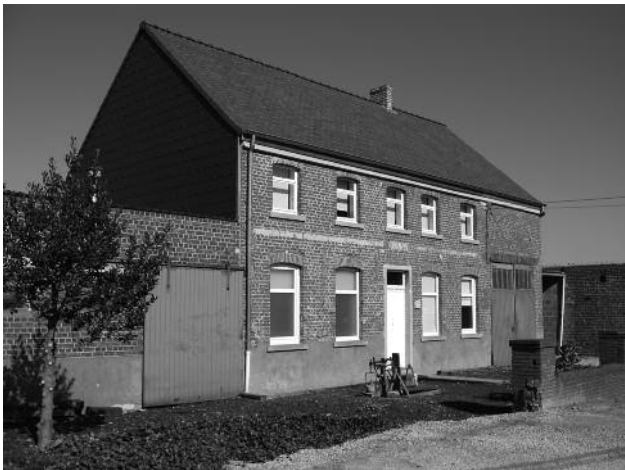
nr 20 : Ernest De Cock Germaine en Louise Beerens - bakkerij