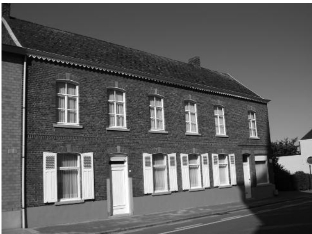
nr 93 : Hector Baeten - Maria Troch Smidse - café