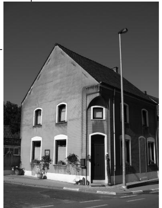
nr 138 : Hector Andries - Bertha Pardaens Specerijenwinkel - café