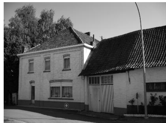
nr 68 : Willy D'haeseleer - Godelieve Van Rossen Groothandel in voedingswaren