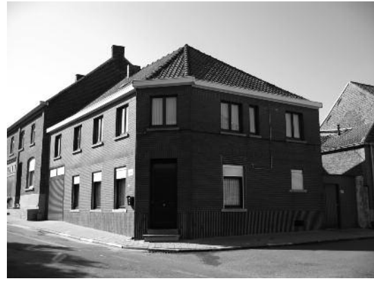
nr 114 : Victor Hanssens - Irma De Koker Schoenen - kruidenierswaren