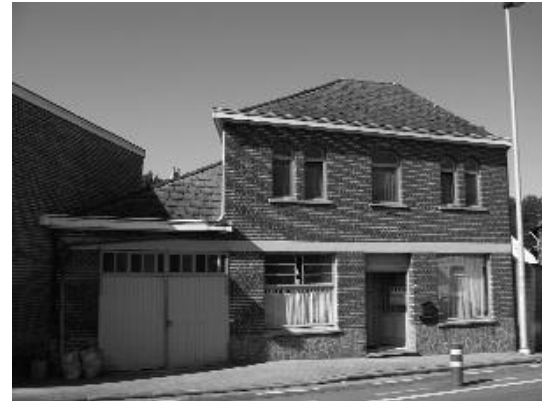
nr 135 : Marcel De Rijck - Alice Ascoop Verf - textiel