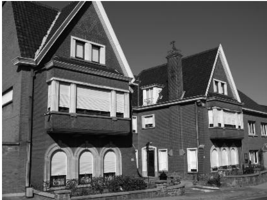
nr 129 : Petrus en Ernest De Cock Pantoffels Deco