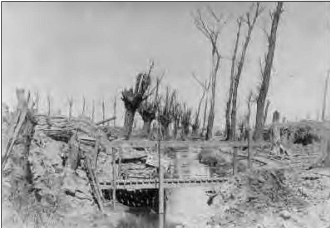
“Het Sas” van Boezingen april 1918

Hij ligt op de militaire begraafplaats te Westvleteren, graf 948.