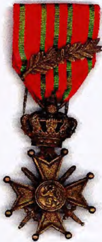
Oorlogskruis 14-18 met palm