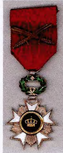
Kroonorde Ridder met zwaarden