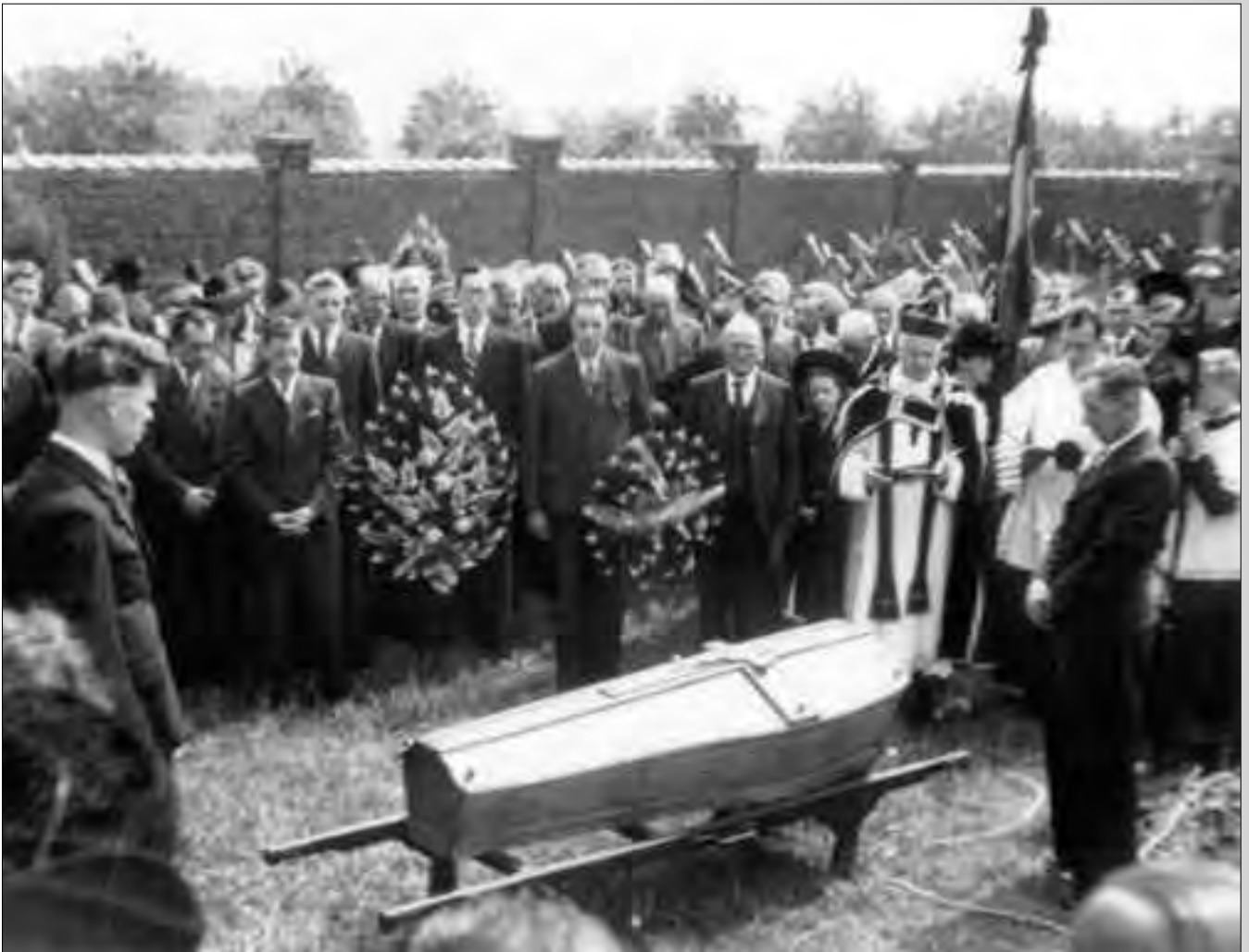
Na de oorlog, op 17 juli 1947 werd het stoffelijk overschot overgebracht naar zijn geboortedorp Kerksen