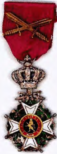
Leopoldsorde Ridder militaire afdeling met zwaarden