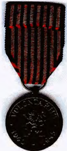
Medaille vrijwilliger 40-45 achterzijde