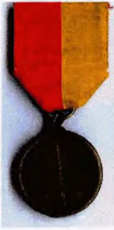
Medaille van Luik 1914