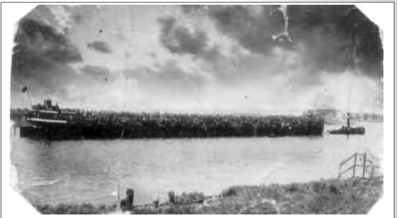
De Rijnaak in het Hollands Diep