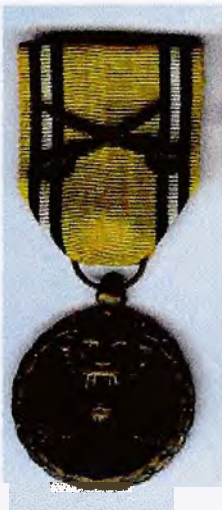
Herinneringsmedaille 40-45 voorzijde