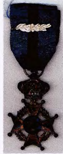
Orde van Leopold II Ridder met palm