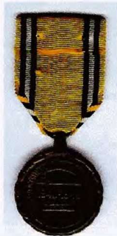
Herinneringsmedaille 40-45 achterzijde