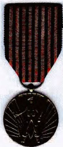
Medaille vrijwilliger 40-45 voorzijde