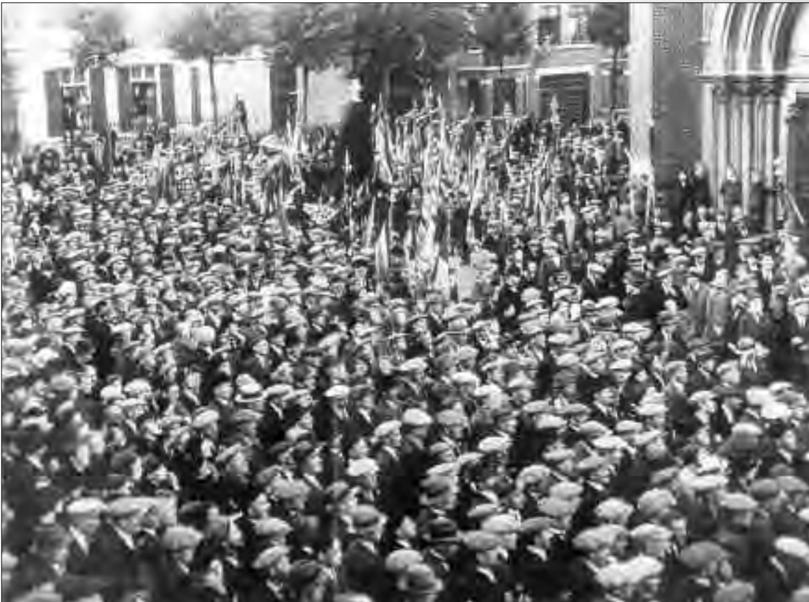
Inbuldiging monument op zondag 22 september 1935!