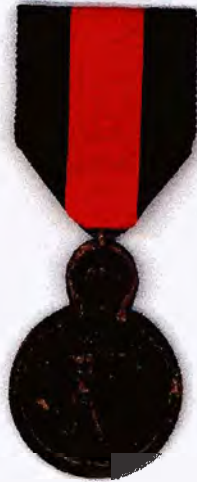
Medaille van de Ijzer