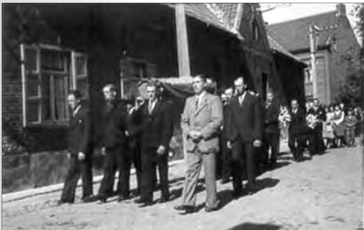
De lijkstond gedragen door burenen, aan zijn geboortehuis, Houtmarkt