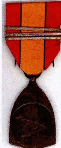
Herinneringsmedaille 14-18 3 baretten