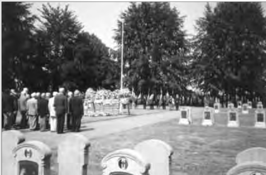
Plechthigheid te Halen