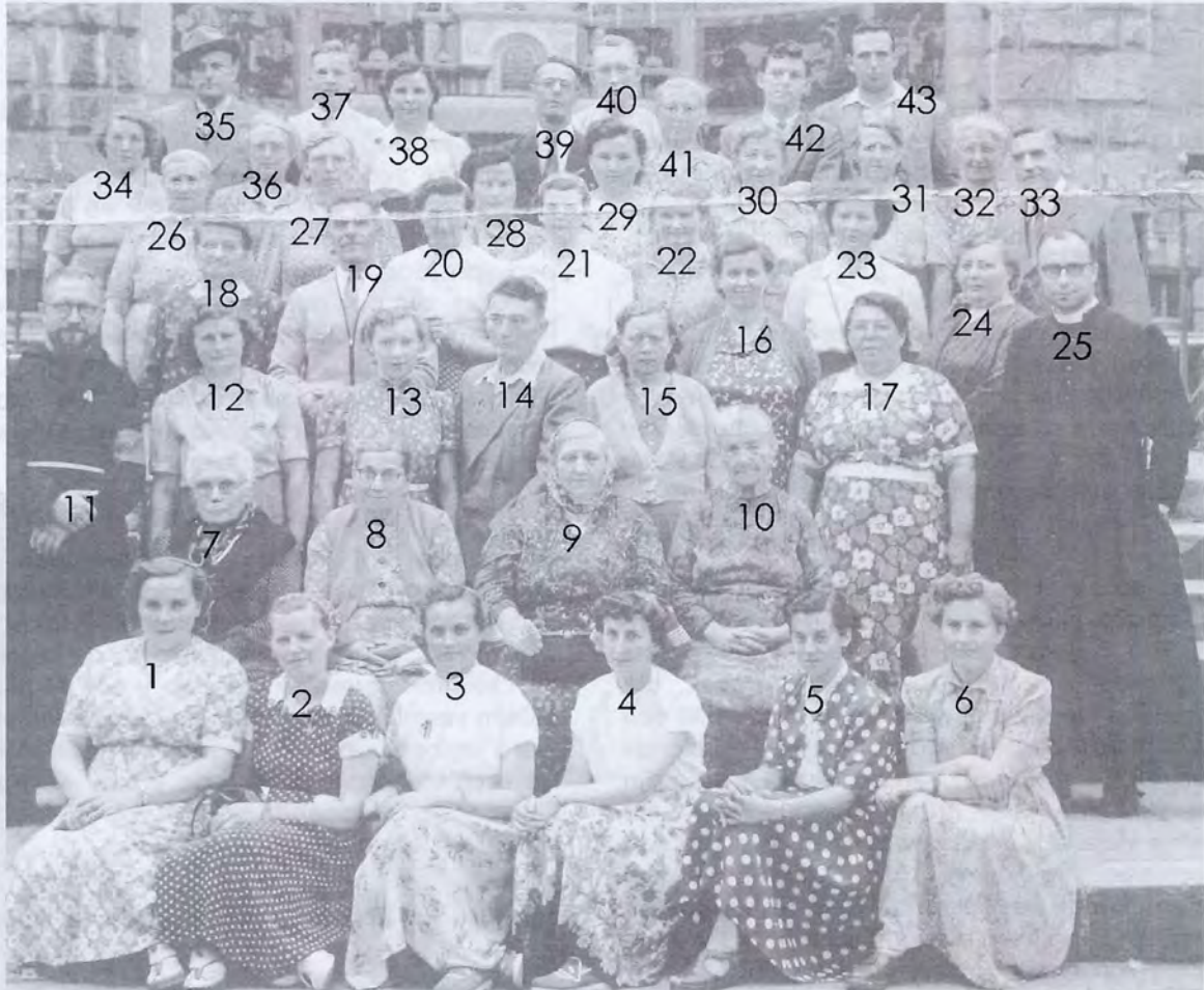
Vele jaren organiseerden KAV en KWB Lourdesbedevaarten. Hierboven de klassieke groepsfoto van een groep in 1953.