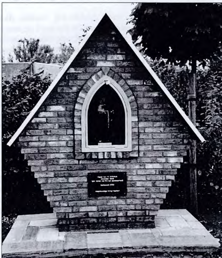
De herbouwde kapel, mooier dan voorheen.