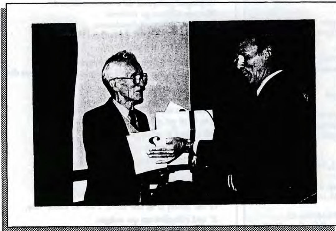
De voorzitter overhandigt een passend geschenk

Het werk ging over de toog als warme broodjes. Bezit je nog geen exemplaar? Een laatste reeks is opnieuw verkrijgbaar bij de boekhandels Gees (Kerksken), Scheerlinck en bij foto Redant op de Hoogstraat. Vlug bijwezen.