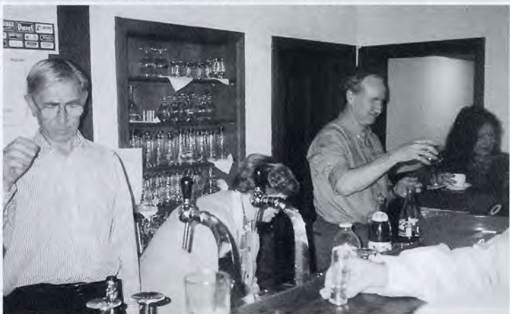
Enkele Df-bestuursleden bij de 'toogactiviteiten'