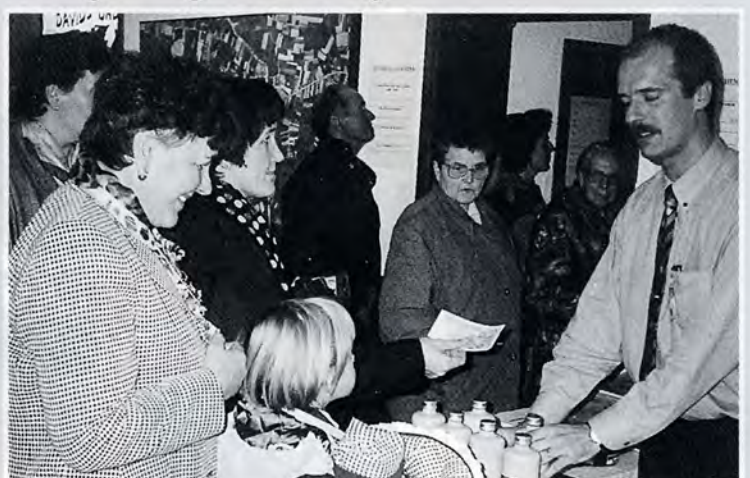
En... een retro-jenever voor gezellige momenten