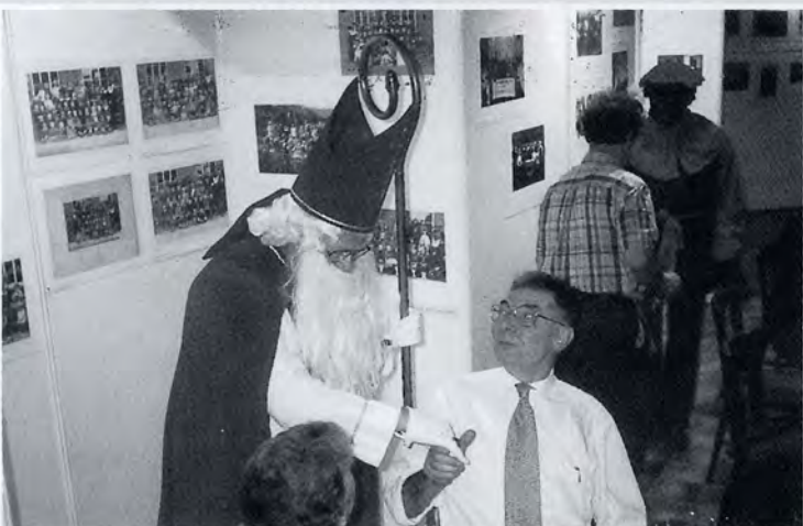
Zelfs de Sint kwam op bezoek