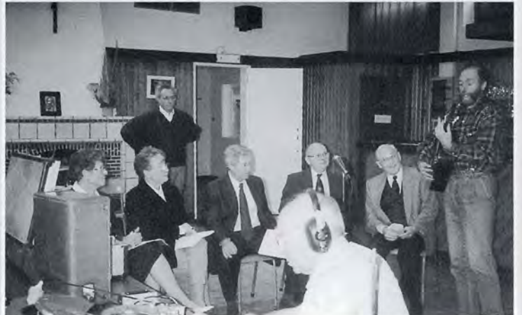
Het retro-koor tijdens een proefopname