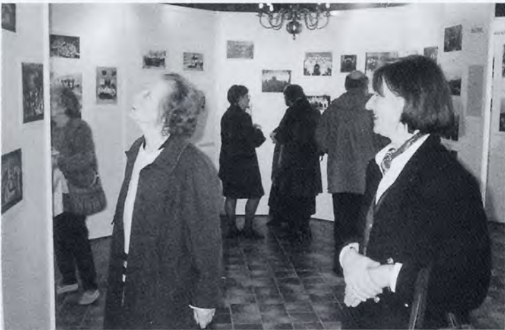
Ook de oudere generatie had belangstelling