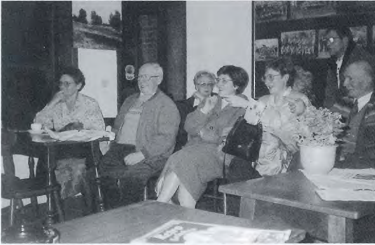
Hilariteit tijdens de videovertoning