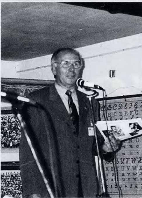
De voorzitter verwelkomt de talrijke aanwezigen bij de opening