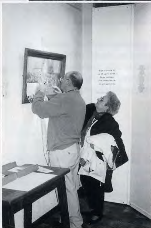
Was ik er bij in 1945?