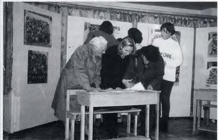
Interesse voor de vroegere leerlingenlijsten