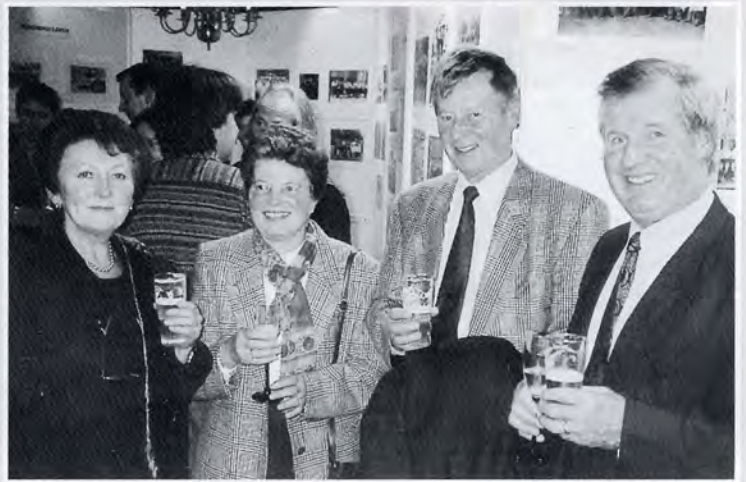
Vrienden van vroeger