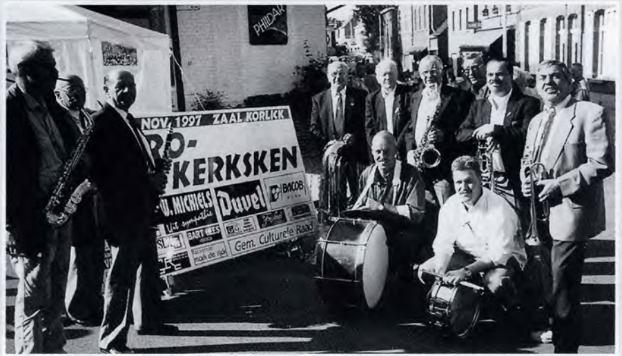
Promotie Retro-Kerksken op het Volksfeest te Haaltert