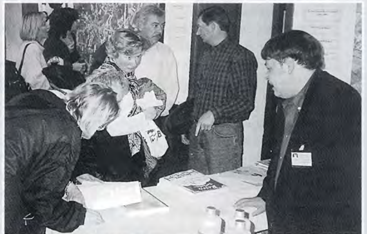
Belangstelling voor de uitgaven van de H.K.