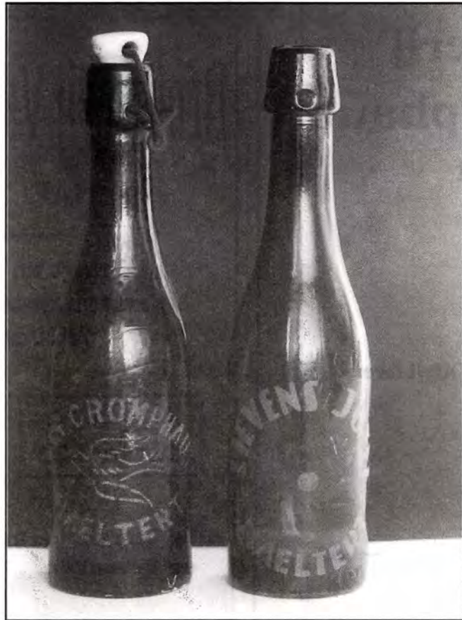
Bierflessen - brouwerijen Van Cromphaut en Jozef Lievens.