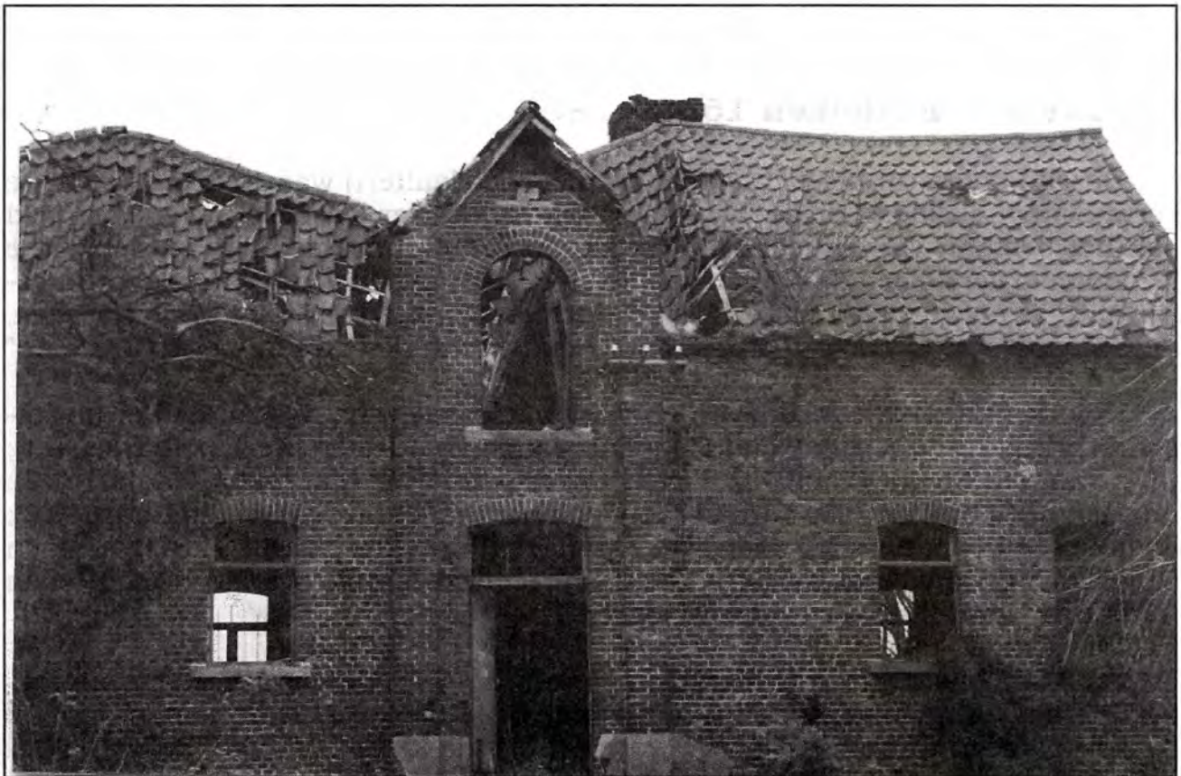
Brouwerij Van Cromphaut (opname 1994).