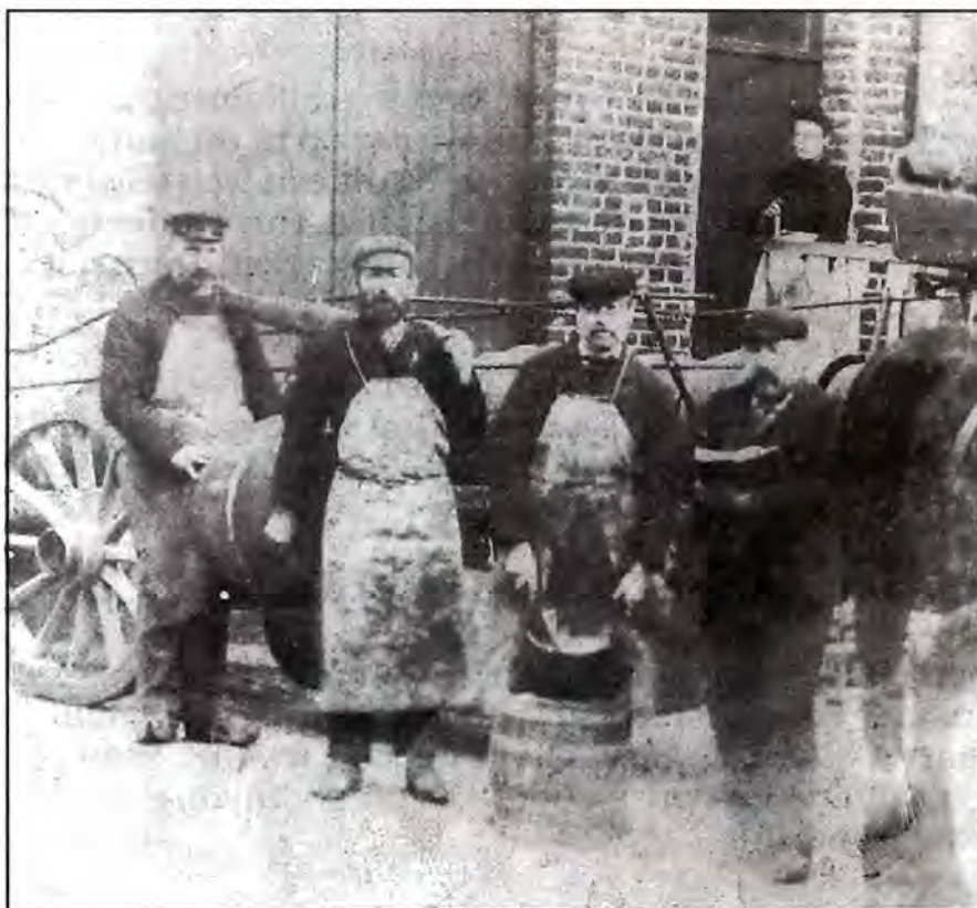
Binnenkoer van de brouwerij Maes