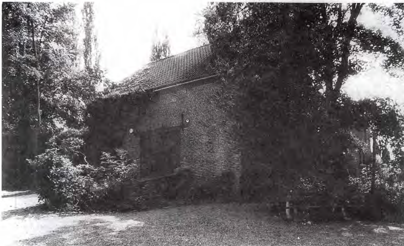
Deelgebouw van de brouwerij de Sadeleer.

Dit gebouw deed o.m. dienst als opslagplaats. Het hellend ingangspad werd later aangelegd. Oorspronkelijk was het een los- en laadkade. De wagen werd tot tegen de poort gereden zodat men de vaten gewoon op het laadvak kon rollen.