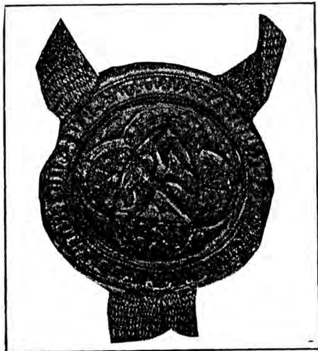
Zegel van Hendrick II

Malen(t)gien(e) ; arglistigheid, kwade trouw.