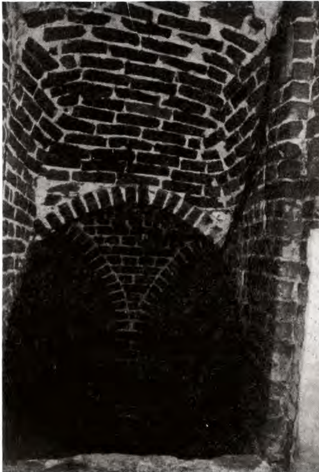
Omer Van Cromphaut.

Gans de hoeve is op grond van uitzicht en constructie niet zo uitzonderlijk maar bezit toch heel wat typische kenmerken van een tijd en bedrijvigheid die definitief voorbij zijn.