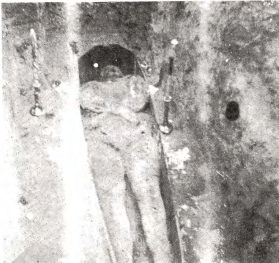
Het lichaam in de geopende doodskist