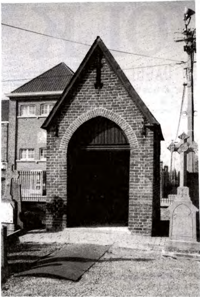
Kapel en graf van Pastoor De Maeyer