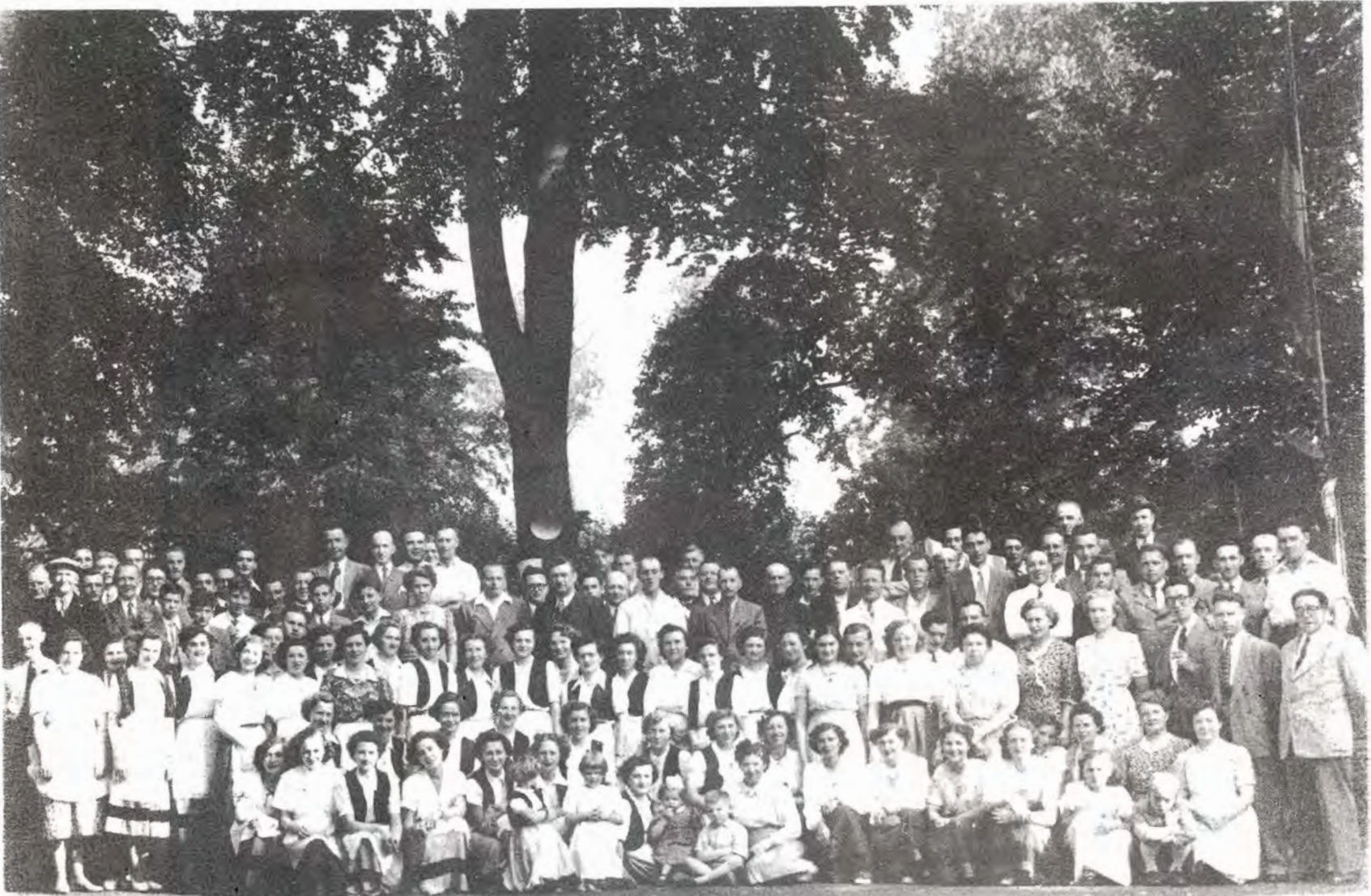
Groepsfoto vrijwillige medewerkers, Warandefeesten 1949