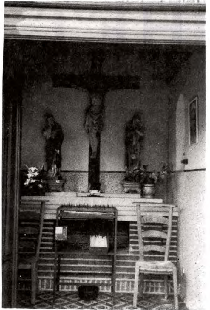
Binnenzicht van de kapel