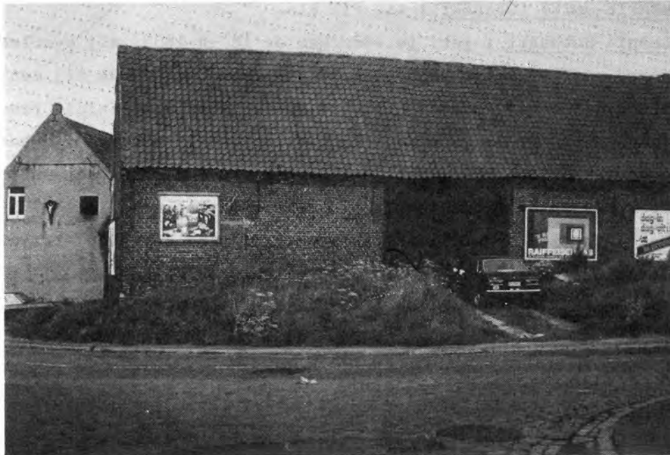
Geboortehuis van Eugénie Cobbaert (bouwjaar ± 1790), verdwenen 1976.

Hippoliet en Delphine worden de ouders van deze kinderen :